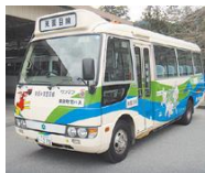
支線バス東菌目線は東栄町営バスが運行しています。