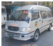
予約バス菌目線は東栄タクシーが運行しています。