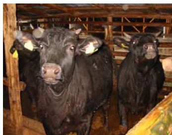
【上のカット写真は、設楽町の風景の一部です。】